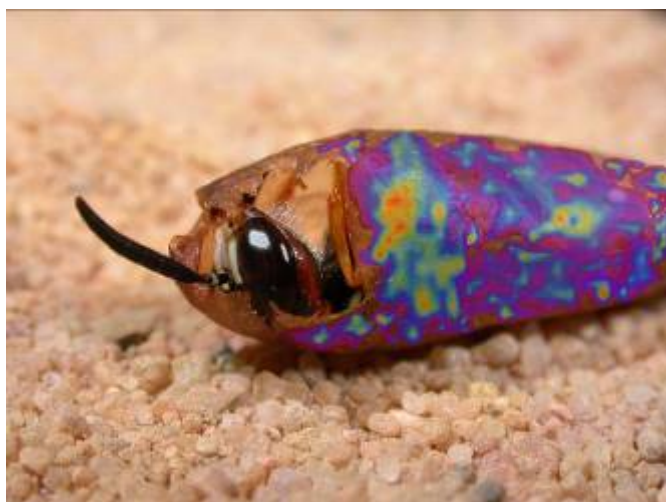
Bild: Mehrere Monate überwintert die Bienenwolf-Larve im Kokon, bevor das ausgewachsene Tier schlüpft. Von Symbionten produzierte Antibiotika auf der Kokonoberfläche gewähren Schutz vor mikrobiellen Schädlingen während der langen Entwicklungsphase. Die Menge der Antibiotika wurde durch bildgebende Massenspektrometrie (LDI-imaging) sichtbar gemacht und in Falschfarben auf den Kokon projiziert.

Grabwespen der Gattung Philanthus , die so genannten Bienenwölfe, beherbergen nützliche Bakterien auf ihrem Kokon, die einen Schutz gegen schädliche Mikroorganismen garantieren. Wissenschaftler des Max-Planck-Instituts für chemische Ökologie in Jena haben nun in Zusammenarbeit mit der Universität Regensburg und dem Jenaer Leibniz-Institut für Naturstoff-Forschung – Hans-Knöll-Institut - herausgefunden, dass die Bakterien der Gattung Streptomyces einen Cocktail aus neun verschiedenen Antibiotika produzieren und damit eindringende Schädlinge abwehren. Mit Hilfe bildgebender Massenspektrometrie konnte in vivo gezeigt werden, dass sich die Antibiotika konzentriert auf der Außenseite des Kokons befinden und diesen so effektiv gegen Infektionen schützen. Der Einsatz verschiedener Antibiotika wiederum verhindert Infektionen einer Vielzahl von pathogenen Mikroorganismen. Somit machen sich Bienenwölfe schon seit Millionen von Jahren ein Prinzip zu Nutze, das in der Humanmedizin als Kombinationsprophylaxe bekannt ist. (Nature Chemical Biology, Advanced online publication, 28. Februar 2010)